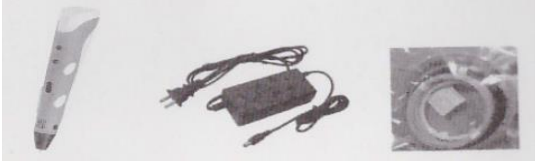
3D Baskı Kalemi